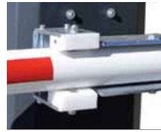
Op aanvraag snelspanner