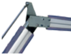
KIT ART Kit voor knikarm voor ovale boom tot 4m